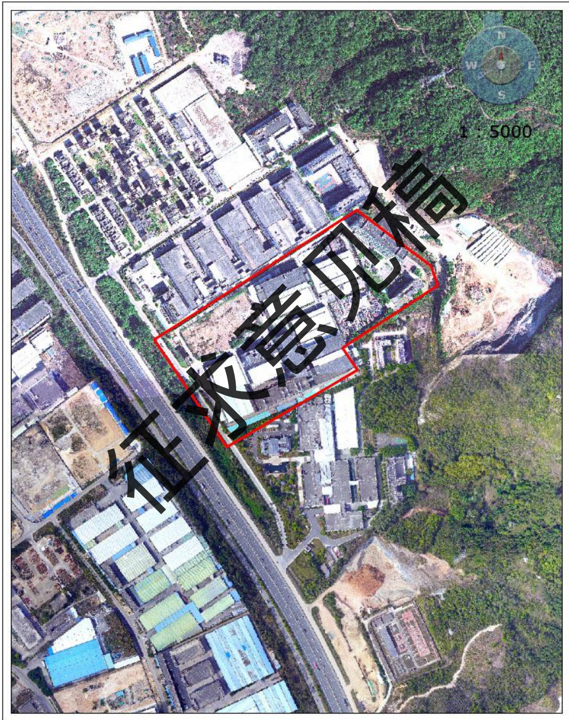
附图 1：项目范围界限图